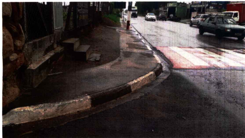
Figura 2. Falta de rampa de acesso para cadeirantes na Avenida Emilio Bosco, 1855, em frente ao Condomínio Vitória da Conquista.