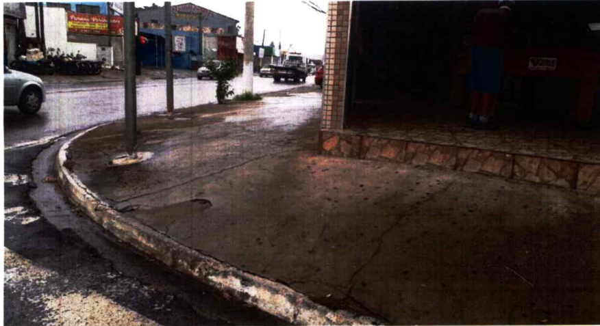
Figura 1. Falta de rampas de acesso para cadeirantes na Rua Flozino Rodrigues da Mata, Jardim São Luiz, esquina com a Avenida Emilio Bosco.